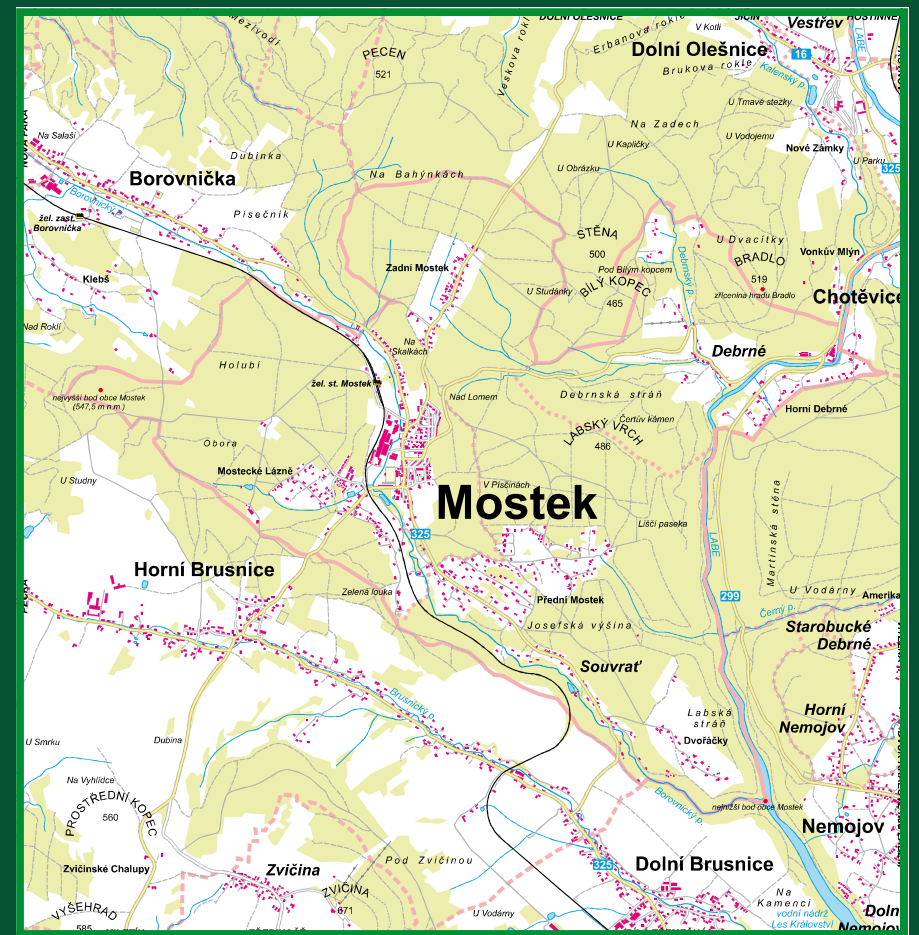
Současná mapa katastru Mostku. Obec se rozkládá na ploše 1331 hektarů. Východní katastrální hranici tvoří tok řeky Labe. Výškový rozdíl mezi nejvyšším a nejnižším bodem katastru je více jak 200 metrů. Z větší části zalesněný katastr poskytuje nejen místním obyvatelům, ale také chalupářům a turistům příjemné klimatické podmínky k bydlení i k rekreaci. Obec je vyhledávaným houbařským rájem (autor mapy Jan Slovík)

Další zásadní mezník v dějinách Mostku nastal po roce 1945, když došlo k odsunu valné většiny původního německého obyvatelstva, který se bohužel neobešel bez krvavých excesů. Nové české a slovenské obyvatelstvo přicházelo z vnitrozemí do obce hlavně za prací do místní továrny, protože průmyslové pohraničí zoufale postrádalo v poválečných letech pracovní sílu do opuštěných továren. Noví čeští osídlenci našli v Mostku svůj nový domov, nenavázali však na kulturní a společenské tradice původního německého obyvatelstva, ale vytvořili si tradice, zvyky, spolky a kulturu novou. Ne vše, co bylo vytvořeno před rokem 1945, bylo špatné a zavrženíhodné. Publikace o historii této obce by současným obyvatelům, a nejen jim měla toto poznání usnadnit a umožnit hlubší seznámení s tím, co vytvořili nejen naši předkové.